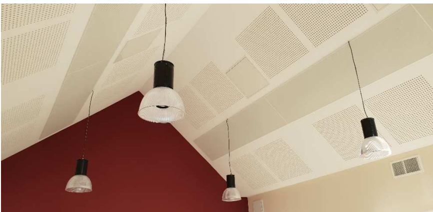
AGTC 45 19 bis rue du Faubourg st Jean 45000 ORLEANS