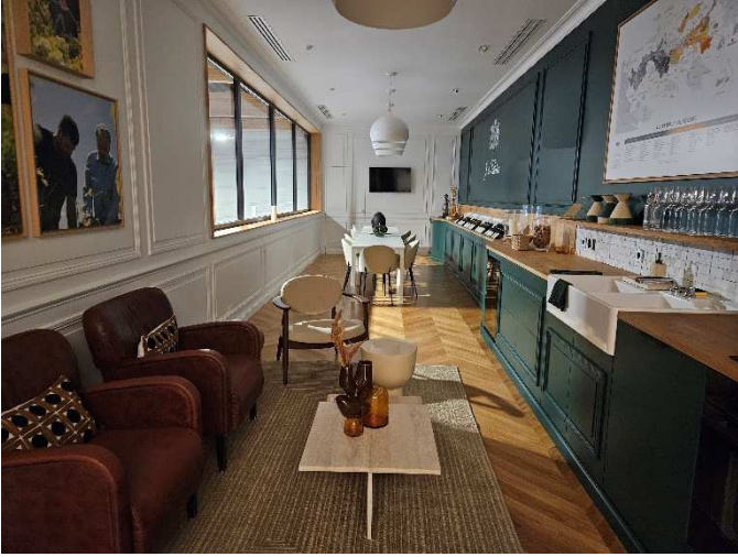
SALLE DE DEGUSTATION