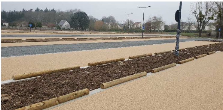
PARKING DES MONTÉES